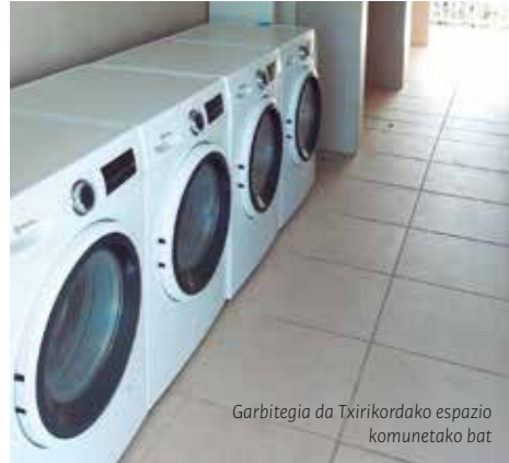
Garbitegia da Txirikordako espazio komunetako bat

Etxebizitza hauek bi logela independente (zainduarena eta zaintzailearena) dituzte, bakoitza bere komunarekin, eta espazio komun zabal bat, non sukaldea eta egongela-jangela dituzten.