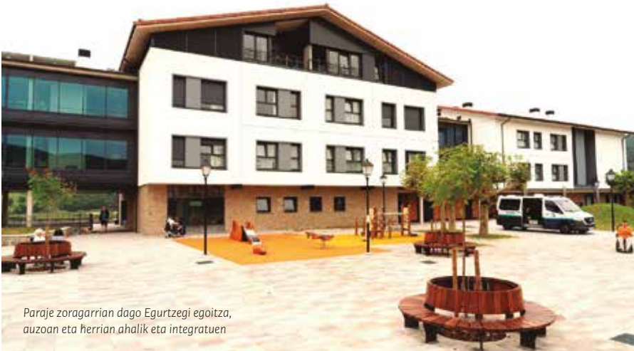
Paraje zoragarrian dago Egurtzegi egoitza, auzoan eta herrian ahalik eta integratuen

Estas viviendas disponen de dos habitaciones independientes (la de la persona cuidada y la de la persona cuidadora), cada una con su propio baño, y un amplio espacio común donde tienen la cocina y el salón-comedor.