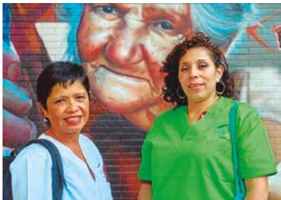
Hernaniko Maitelan kooperatibako langile-bazkideak

El cuidado no es solo un servicio: es también una oportunidad para fortalecer las redes de relaciones, la comunidad y el trabajo comunitario (auzolana).