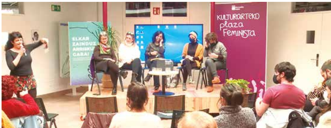
Hernanin egindako zaintza-jardunaldiak

Azken urteotan gero eta ageriagoa da zaintza-aren krisia: biztanleriaren zahartzea, mendekotasun egoeren hazkundea eta familia egituren aldaketa direla medio, egungo sistemek ez dute herritarren ongizatea bermatzeko gaitasunik. Begi-bistakoa da zaintzak antolatzeko moduak ez direla nahikoak eta eraldaketa sakona behar dela.